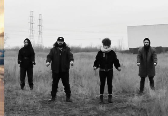
Rap N' Roll - Nomadic Massive