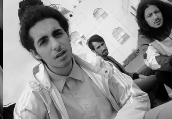
Conformopolis - Clay and Friends