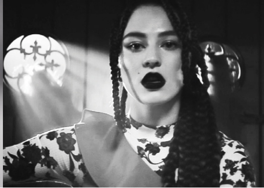
Queendom - Modlee