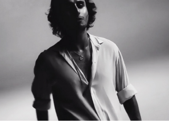
Changes - Final State