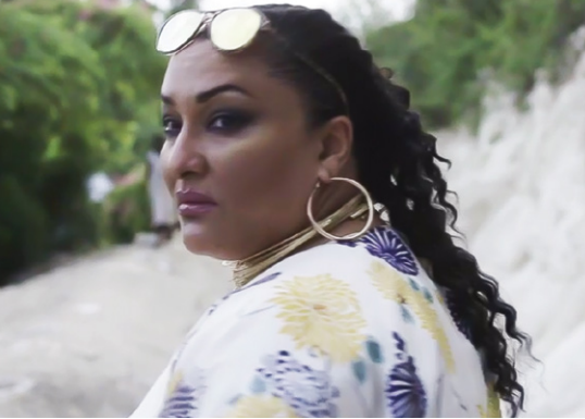
Fanm Vayan - Stéphane Moraille