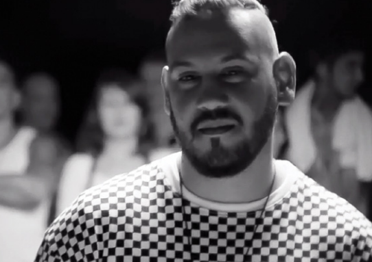
Tanto Tattoo - Boogat