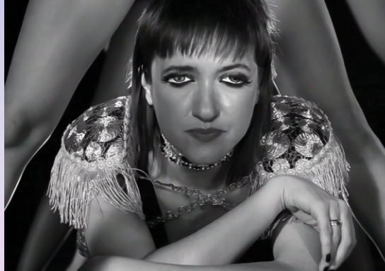
Hop the fence - Blood and Glass