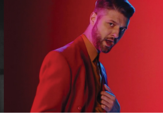
Sais-tu vraiment qui tu es? - Pierre Lapointe