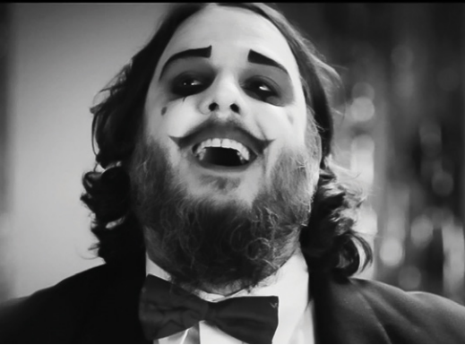
Dévisse - Les Cowboys Fringants