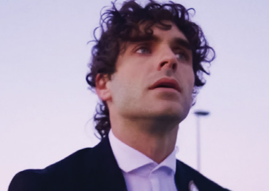
Jeter un sort - Alex Nevsky